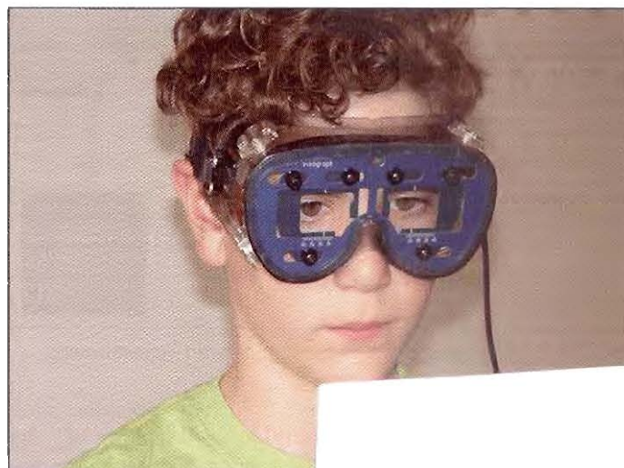
Der Visagraph III

Eine Spezialbrille wird der Testperson aufgesetzt und auf die Pupillendistanz eingestellt. Der Proband liest eine kurze Geschichte und beantwortet anschließend zehn Fragen zum Textinhalt. So kann auch das Leseverständnis in die Analyse mit einbezogen werden. Aus diesen Daten generiert die Software eine Simulation der Augenbewegungen sowie verschiedene Auswertungen und Darstellungen der Resultate. Diese Werte geben Einsicht in die visuelle Wahrnehmungsfähigkeit einer Person und stellen dar, mit welcher Leichtigkeit, welchem Komfort und welcher Effizienz sie einen Text liest.