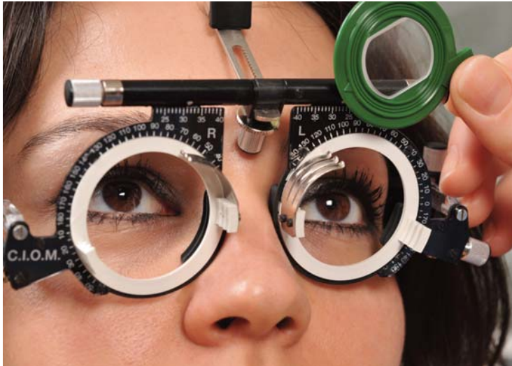
Jedes Jahr mehr Minusdioptrien – das muss nicht mehr sein!

Nimmt die Kurzsichtigkeit immer mehr zu, ist das für viele eine beängstigende Situation und führt zu Fragen: wird es immer schlimmer – wann hört es auf – was kann ich dagegen tun – werde ich blind? Die gute Nachricht: Hilfe ist in Sicht!